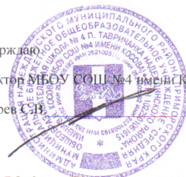
График Питания учащихся МБОУ СОШ №4 п. Тавричанка