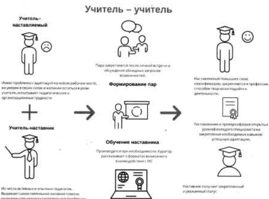
Рис. Графическое представление реализации программы наставничества по форме «учитель – учитель».