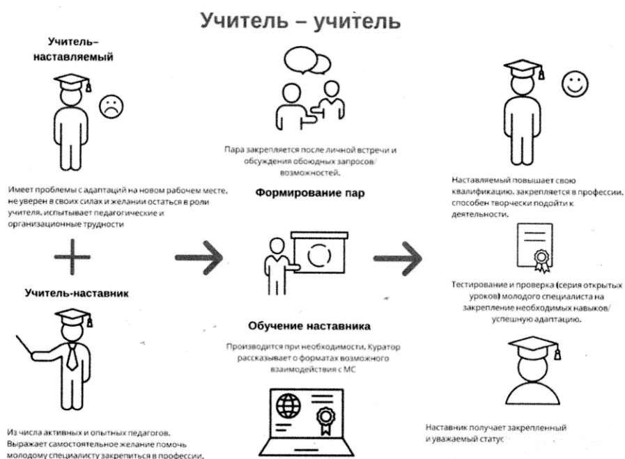
Рис. Графическое представление реализации программы наставничества по форме «учитель – учитель».